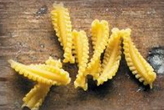
Фестонате Донние Кон Джамелло