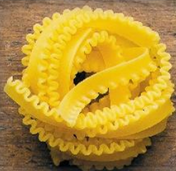
Гнезда Фестонате Семпличи