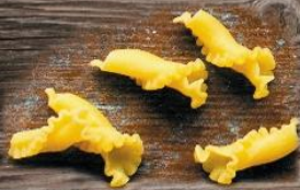
Фиори Фестонате Ригати