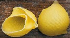
Ракохо для начинки