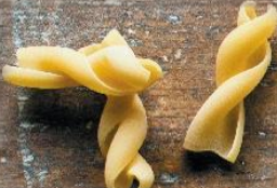
Макарони Ди Каза Гранди